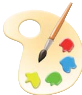
Les Couleurs de l'Accompagnement

La foi ne suffit pas ; la force des Couleurs vient de leur capacité d'actions sur le terrain. Ensemble.